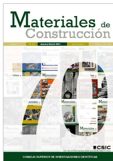
Figura 2. Portada actual de la Revista (2021).