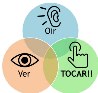
Figura 1. Esquema de la complementariedad perceptual en la asimilación de conocimientos.